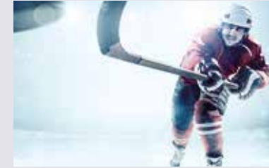
METZ 64xx THE DIRECT ONE