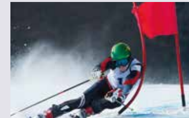
METZ 59x THE ACCESSIBLE ONE