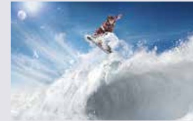
METZ 56x THE COOL ONE