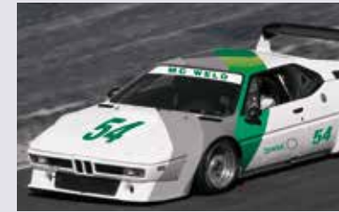
METZ 54x THE CLASSIC ONE