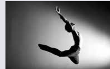
METZ 52x THE SLIM ONE