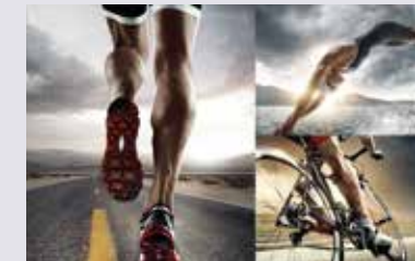
METZ 57x THE ALLROUNDER