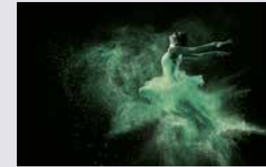
METZ 58xx THE PRECISE ONE